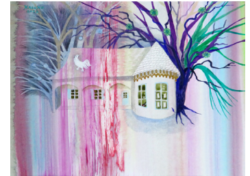
「フランスのオンドリ」 紙にアクリル 14×18cm 2022

2020, '17, '15, '10, '09 Galleria Ponte (石川) 2012, '11, '10, '09, '08 Shonandai MY Gallery (東京) 2010, '09 木之庄企畫 (東京) 2007 エスパシオ・タオ (スペイン)、美術サロンゆたか (石川) 2006 第40回レスポワール展 スルガ台画廊 (東京) ギャラリー・ネブロッサ (野村国際文化財団助成/メキシコ) 2005, '03 すどう美術館 (東京) 2004, '02 スルガ台画廊 (東京)