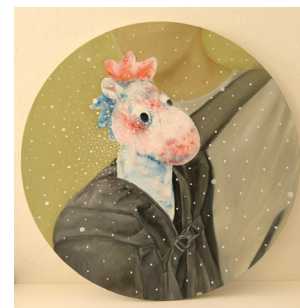
「horse doll」 キャンバスに油彩 Φ50cm 2021