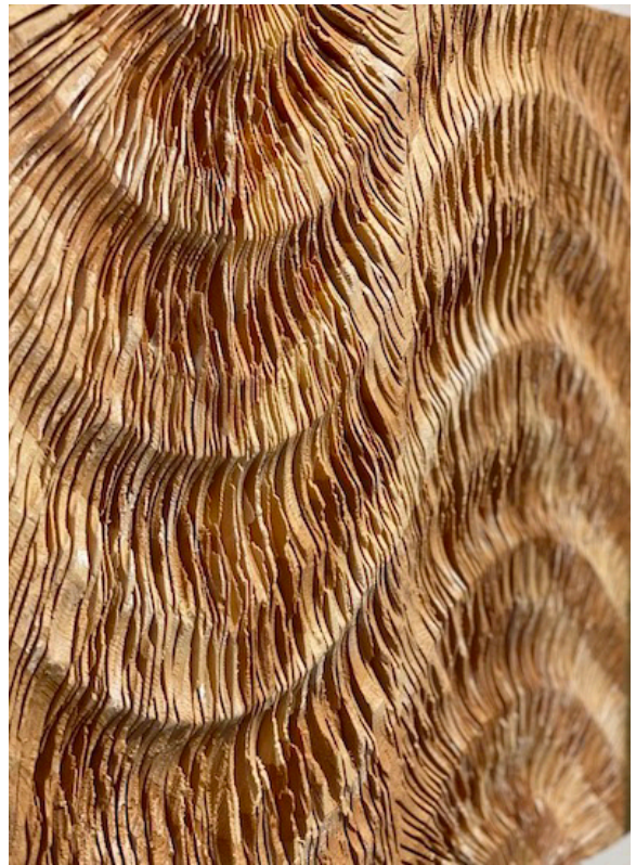
‘ Flow ’ Pinewood, pine resin, kakishibu, beeswax, plaster, etc. 500×500×40mm 2019(部分)

2020年2月21日(金)~3月1日(日) 会期中無休 時間: 12:00-19:00 ※最終日は17:00まで オープニングレセプション: 2月21日(金)18:00~20:00 Room 2