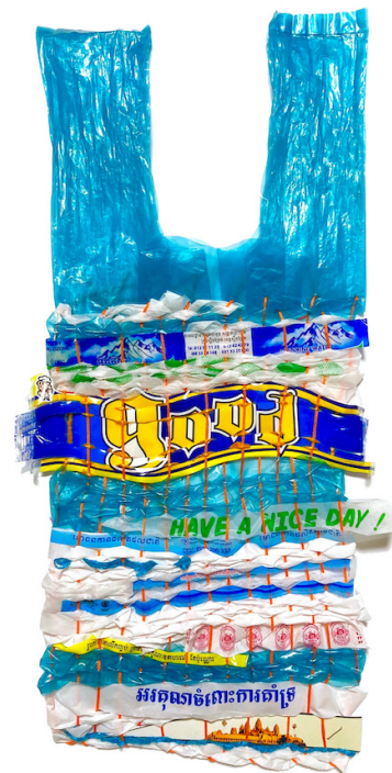
"shoppingbags 22" レジ袋, パッケージ, 糸 38.5×19cm 2024

s+arts (スプラスアーツ) より、海老塚季史 個展「旅と生活」の開催をお知らせいたします。