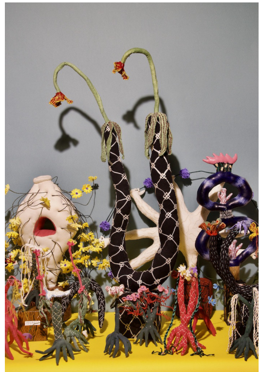
“Flower pot” “Precious weeds” 生地、フェルト、針金、アクリル絵の具 2022

*レセプションパーティーはございません。 *急遽展示日程や時間の変更等がある場合がございます。 ホームページやSNSをご確認の上、 ご来廊下さいますようお願い申し上げます。