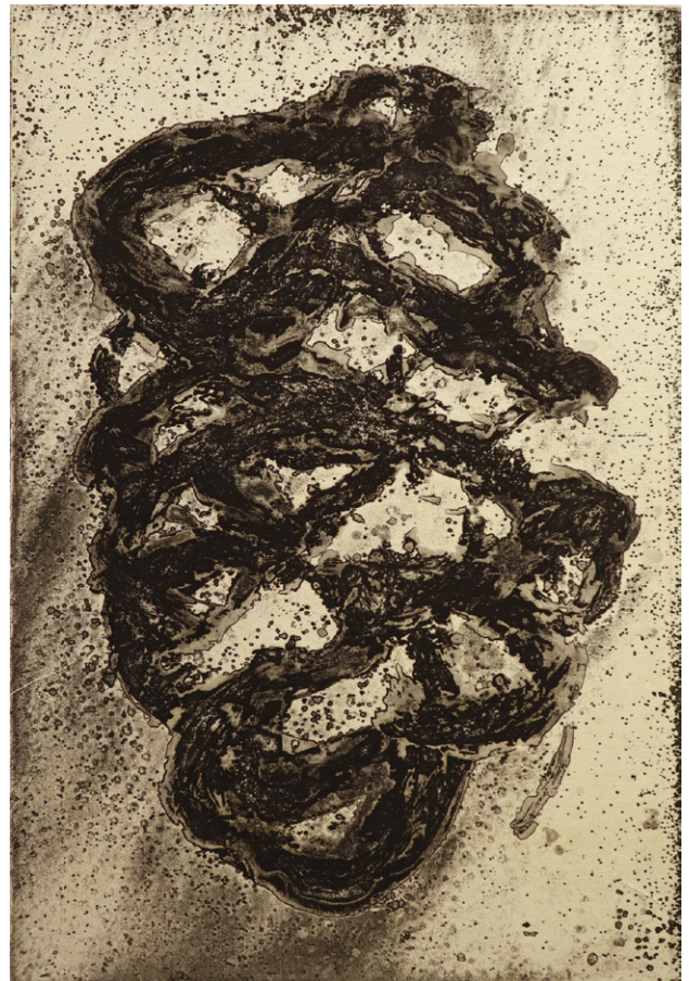
“ The Days - Continue ” etching 320x220mm 2019

2019年11月15日(金)~11月24日(日) 会期中無休 時間: 12:00-19:00 ※最終日は17:00まで レセプションパーティー: 11月15日(金)18:00~20:00 Room 1