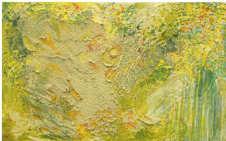
“待つ” oil, oil pastel, shell, calcite on canvas 33.5×53cm 2021

*レセプションパーティーはございません。 *急遽展示日程や時間の変更等がある場合がございます。 ホームページやSNSをご確認の上、 ご来廊下さいますようお願い申し上げます。