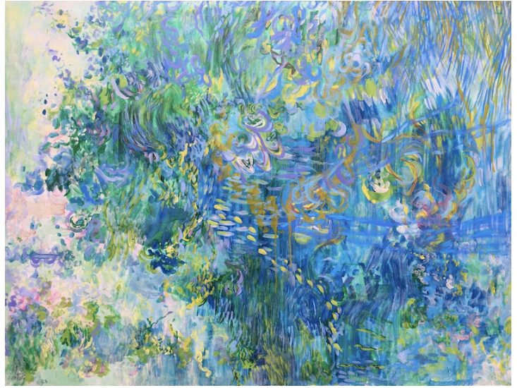
“ 降り続く、この時間は ” oil on canvas 91×117cm 2023

*レセプションパーティーはございません。 *急遽展示日程や時間の変更等がある場合がございます。 ホームページやSNSをご確認の上、 ご来廊下さいますようお願い申し上げます。