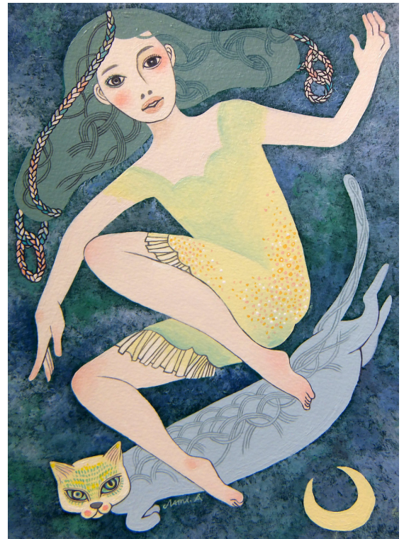
“ネコと翔ぶには良い夜だ” acrylic on paper 29.5×20cm 2020 (部分)

s+arts (スプラスアーツ) より、会田菜美 個展「As you can see」の開催をお知らせいたします。