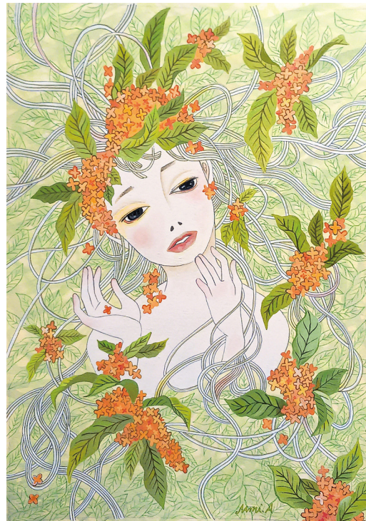
“ 金木屋 ” acrylic on paper 36×25cm 2024

s+arts (スプラスアーツ) より、会田菜美 個展「Nature」の開催をお知らせいたします。