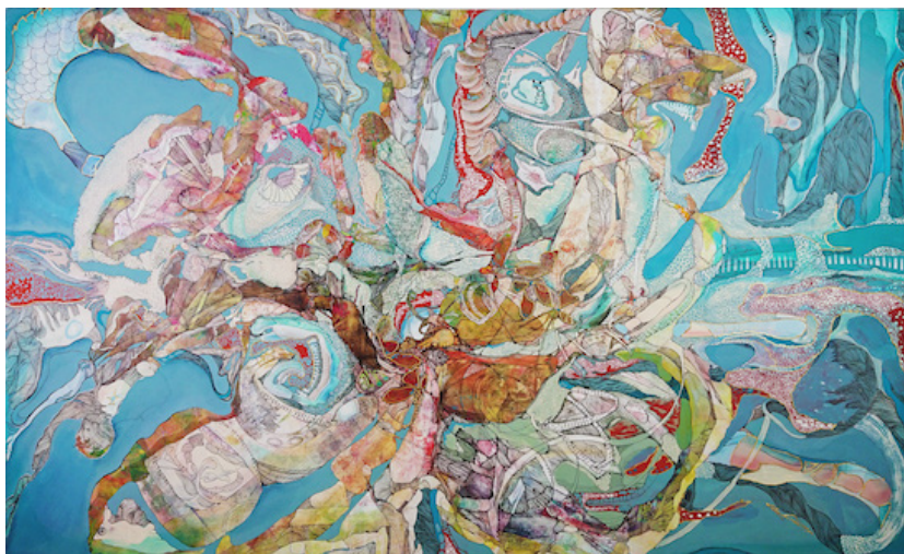
“星根” mixed media on panel 880×1460mm 2020